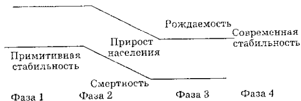
Рис. 1. Демографический переход

– катастрофическая – деградация экосистем с потерей присутствующих биологических свойств;