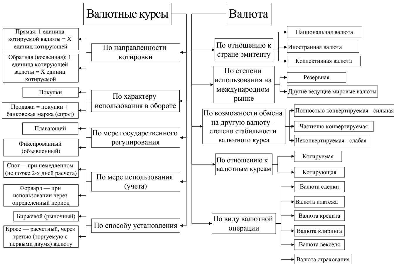
Рис. 1 . Классификация иностранных валют и валютных курсов

Для того чтобы общаться на одном языке, все участники валютной торговли признают и соблюдают сформировавшиеся со временем международные стандарты и правила. Так, например, для обозначения валют во всех письменно заключаемых сделках, а также при их подтверждении применяются так называемые ISO-коды (ISO - международная организация по стандартизации). Они связаны также с международными платежами.