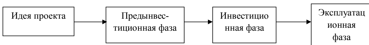
Рис. 1. Инвестиционный цикл.

Разработка любого инвестиционного проекта – от первоначальной идеи до эксплуатации – может быть представлена в виде цикла, состоящего из трех стадий: предынвестиционной, инвестиционной и эксплуатационной (или производственной). Суммарная продолжительность трех фаз составляет жизненный цикл (срок жизни) инвестиционного проекта (project lifetime), что можно представить в виде рисунка (рис. 1).